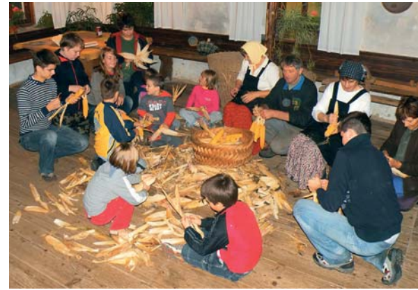
Primer dobre prakse: FENIX – UTRIP KANOMLJE

S podpiranjem izvajanja različnih kulturnih, motivacijskih, izobraževalnih, društvenih in družabnih dejavnosti je vsem krajanom omogočeno, da se vključijo vanje. Aktivnim društvom in interesnim skupinam se omogoča njihovo delovanje, ostale in nove pa se spodbuja k ponovnemu zagonu.