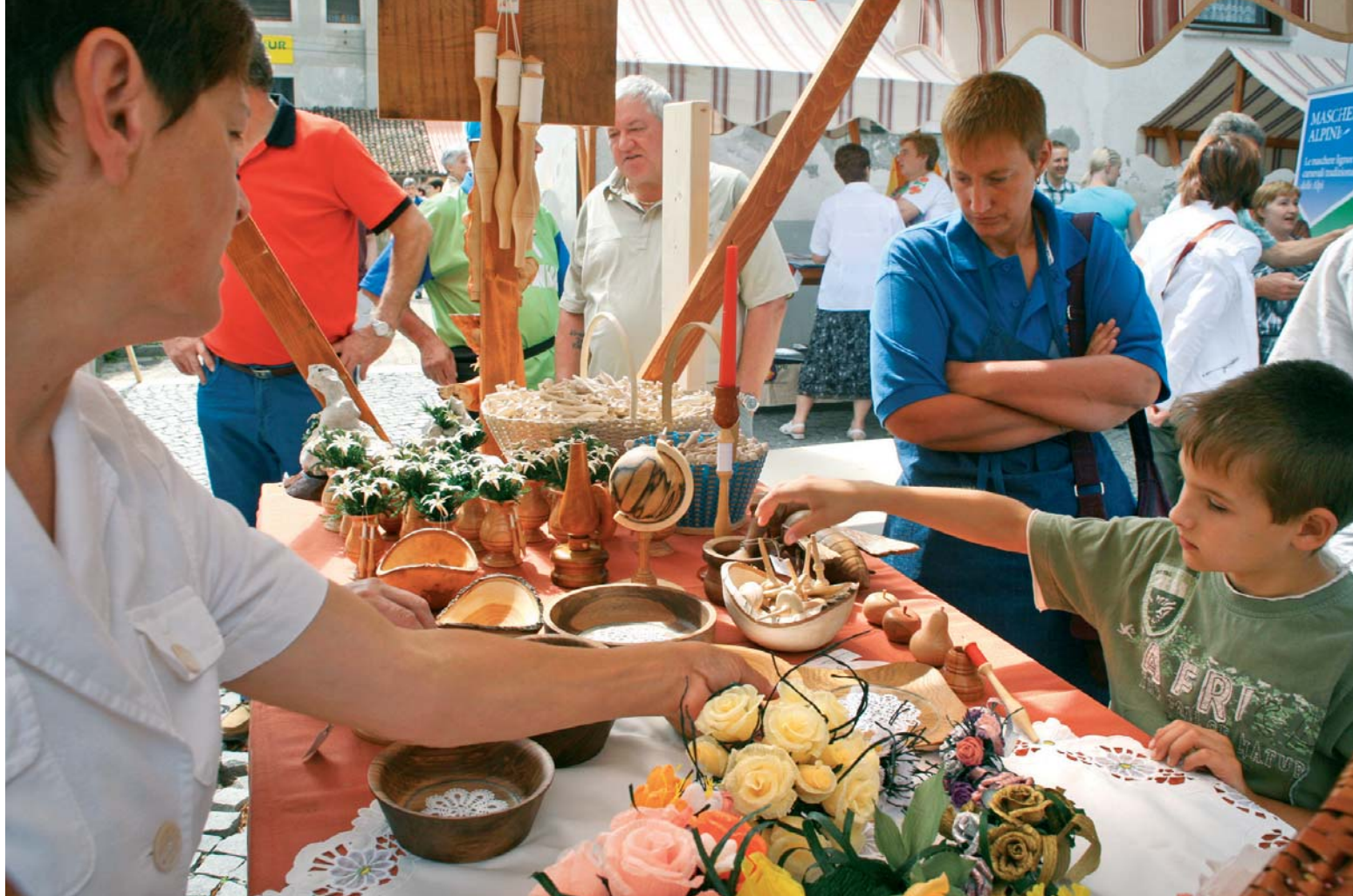
Primer dobre prakse: PODPORA PRIREDITVAM NEVLADNIH ORGANIZACIJ NA OBMOČJU LAS